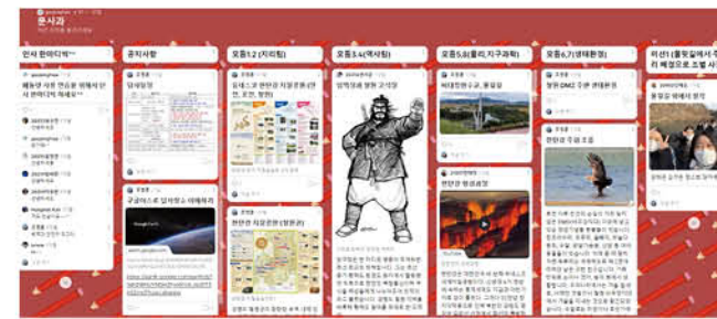
▲ '페들렛'을 활용한 사전 학술 조사 및 발표 자료