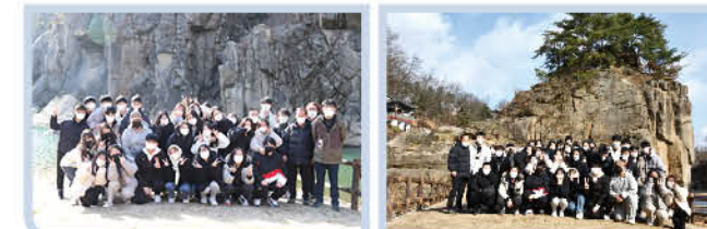
▲ 고석정에서 지리·역사·인문·과학·통일 등을 주제로 발표