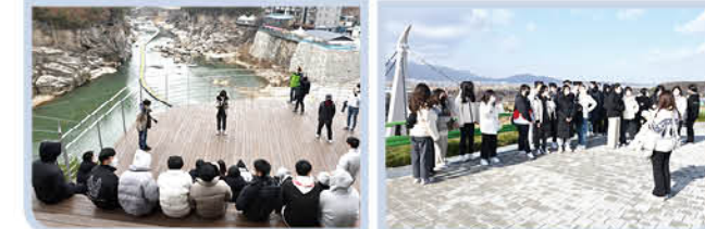
▲ 철원 용암대지 위에서 STEAM 융합답사 프로그램