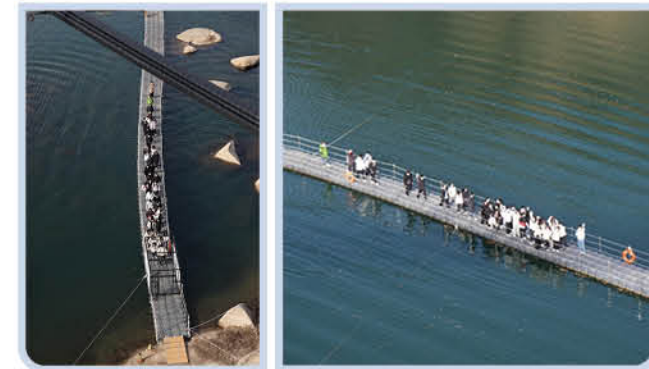
▲ 한탄강 주상절리길 송대소-은하수교 물윗길 트레킹