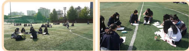
▲ 유네스코 정신을 반영한 글제로 실시한 백일장