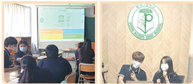
▲ 크롬북을 활용하여 유네스코 주제로 전교생이 참여한 골든벨