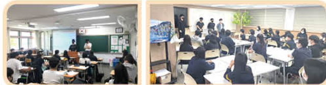
▲ 인문·예술 분야로 진학한 졸업 선배와의 만남

3. UNESCO 독서 골든벨 - 06.11(1차), 11.26(2차) -