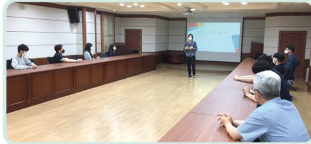
▲ 수진2동 마을계획단 및 도시 재생 사업 관련 프로젝트 협의