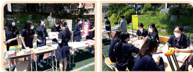
▲ 나눔·봉사·문화·예술 등을 주제로 한 인문학 산책