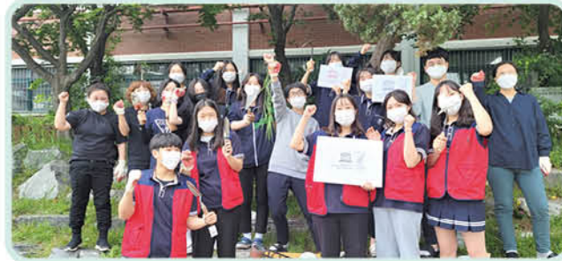
▲ 지역사회와 함께하는 꽃밭가꾸기 (풍생고 학부모회와 학생회)