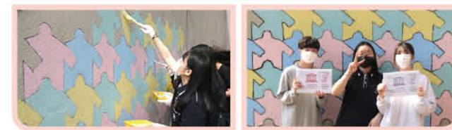
▲ 수학·과학 관련 동아리 학생들의 친환경적 벽화 그리기 활동