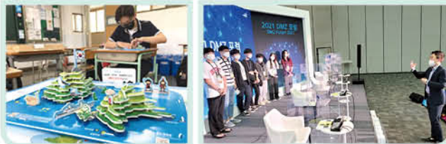
▲ '통일바라기' 자율동아리 활동 「Let's DMZ 포럼」 및 답사