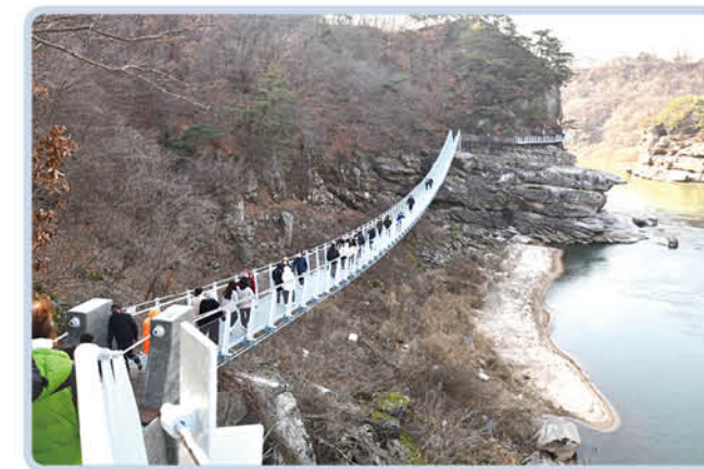
▲ 2021.11.19. 개통한 강원도 철원 '순담계곡 주상절리 잔도길'