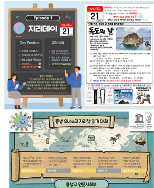
▲ 생활 속의 지리 상식 넓히기 '지리데이'와 '지리책 읽기' 행사