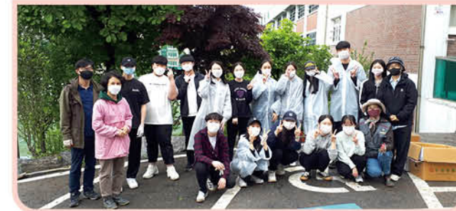
▲ 바이오스 동아리 학생들의 교내 화단가꾸기 활동